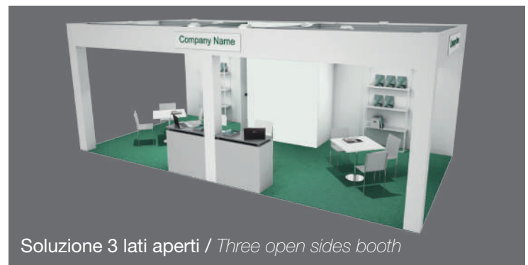
Soluzione 3 lati aperti / Three open sides booth

Le immagini e i colori sono puramente indicativi / Images and colors are just an example