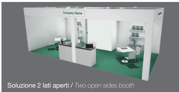
Soluzione 2 lati aperti / Two open sides booth