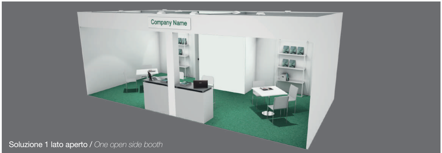
Soluzione 1 lato aperto / One open side booth